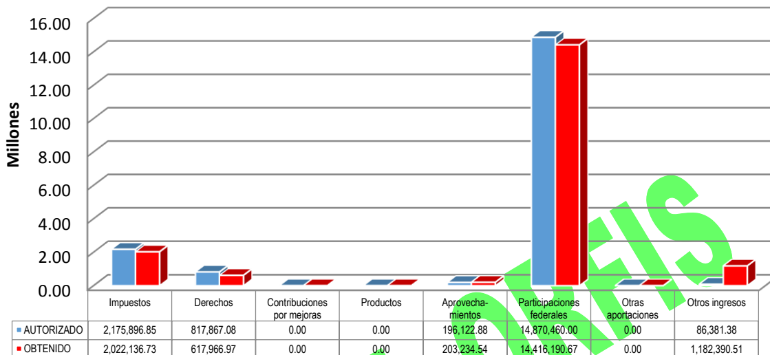
GRÁFICA 1 INGRESOS

Otros ingresos: CONADE $745,300.00, Instituto de la juventud $200,000.00, Remanente Bursatilización $232,380.11 y Recaudación Diaria $4,710.40.